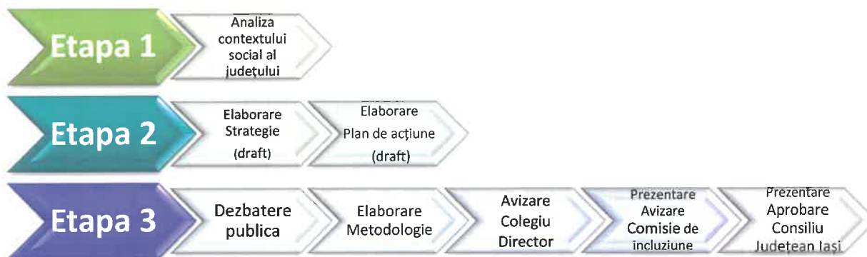
Schema logică a demersului de elaborare și aprobare Strategie

Prestarea serviciului va fi structurată pe 3 etape , fiecare dintre acestea înglobând activități specifice, desfășurate într-o succesiune logică, adecvată metodologiei de realizare a strategiilor de dezvoltare și cu valorificarea corespunzătoare a rezultatelor activităților, în vederea obținerii unui nivel ridicat al calității documentului programatic, după cum urmează: